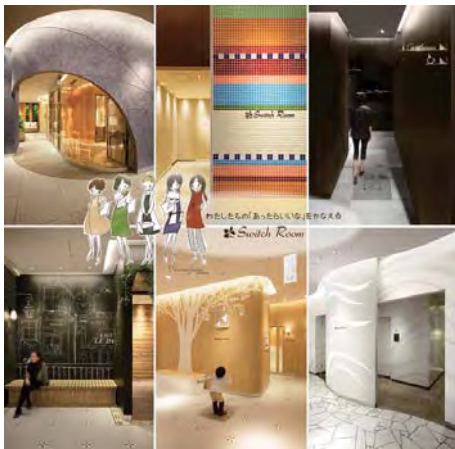
●全6フロア異なるデザインのエントランス。お気に入りのSwitch Roomをセレクトする楽しみを提供

施設の顧客ターゲット層に近い年齢、感度を持つ女性たちでプロジェクトチームを結成し、「実際に自分たちが欲しいもの」の感覚を大切にしながらプロジェクトを進めました。全6フロアにおけるフロアマーチャンドライジングから各フロアのテーマを導き、それぞれ異なるデザインと仕掛けを提案。「Switch」する驚きと心地よさを心と体で体験する場をデザインすることで、今までにないレストスペースを実現しました。