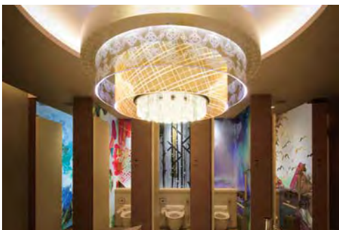
●遊び心を忘れない女性たちの、好奇心と刺激のSwitchをOnにするSwitch Room