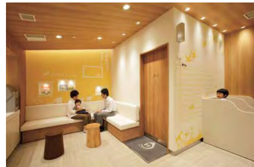
●「女性としての楽しみ」も「子育ての楽しみ」も大切にして生きる女性のためのベビー休憩室