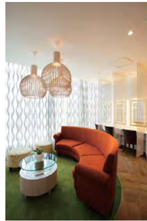
●アクティブな日常から切り替え、リラックスのSwitchをOnにするスペシャルラウンジ