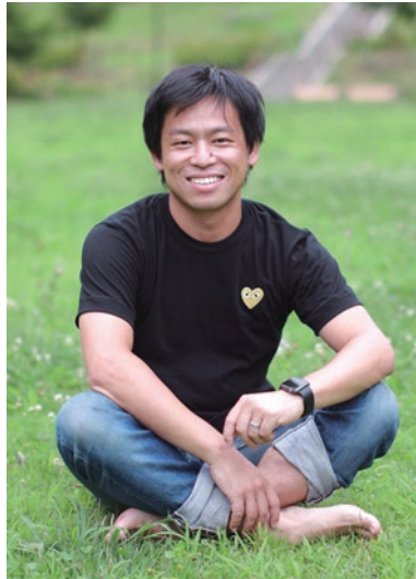
農業生産法人 株式会社 GRA 代表取締役 CEO