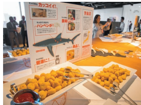
イベント後の懇親会では気仙沼市のサメ肉を使ったシャークナゲットや東松島市の地ビールもふるまわれた