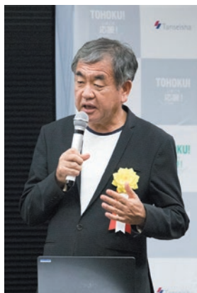
隈研吾建築都市設計事務所 主宰