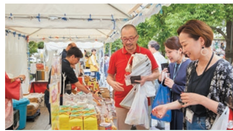
オフィスワーカーや地域の方に向け、岩手県、宮城県、福島県の水産加工品等の産品を販売