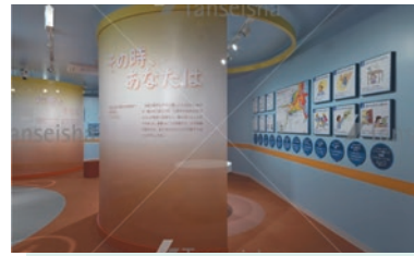
「久慈地下水族科学館もぐらんぴあ」内 防災展示室あーすびあ