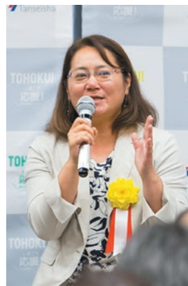
アサヒグループホールディングス 株式会社 CSR部マネージャー(当時)

活用をタブー視されてきた、負の遺産/津波遺構「たろう観光ホテル」。魂のよりどころ、地域を知ってもらうためのよりどころとして保存を決めた市の考えと、追体験による災害記憶の伝承による生きた防災教育をおこない、そこに関わる人々との交流から導かれる、まちの活性化への可能性について話された。