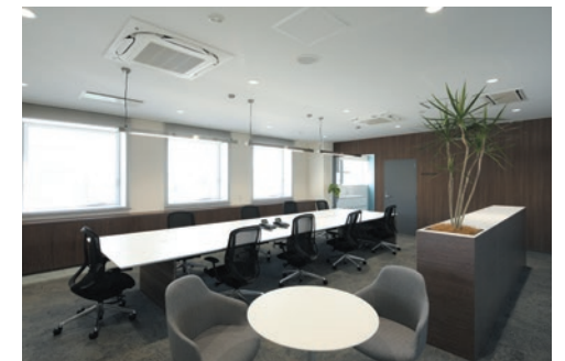
オープンで使いやすい執務室