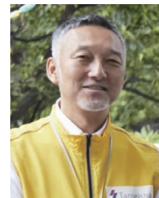
ファシリテーター 株式会社 丹青社 文化空間事業部 地域創生支援室 プロデューサー