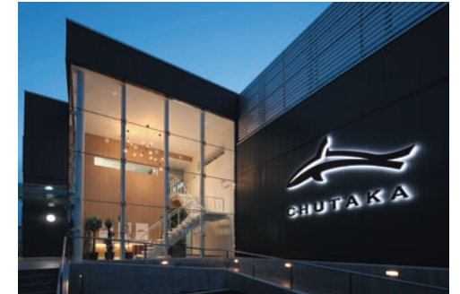
外部サインとエントランス