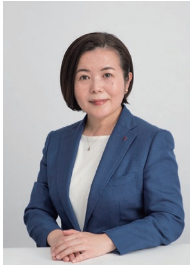
株式会社 丹青研究所 取締役 文化財環境研究部 部長 国際文化観光研究室 室長