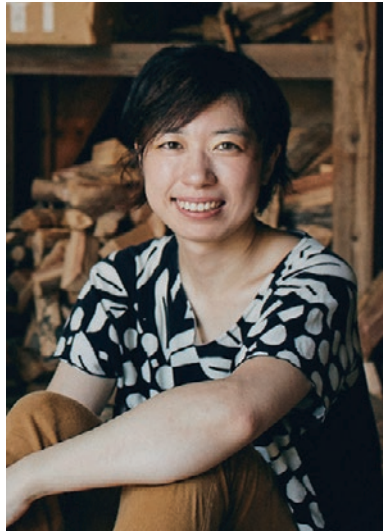
株式会社 巻組 代表取締役