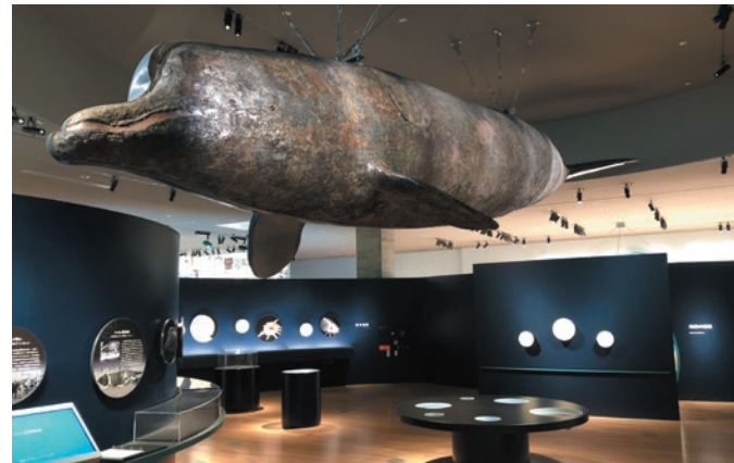
修復された「つっちい」が出迎える貝の部屋