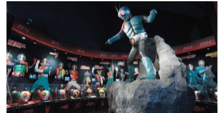
1号から最新の仮面ライダーがここに集結 ©石森プロ・東映