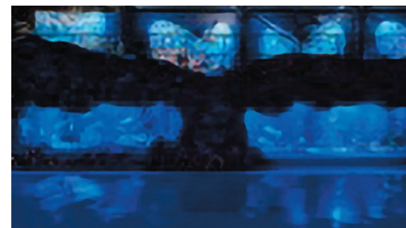
魚たちが泳ぐ中、壁面グラフィックにも海の生き物たちが出現