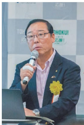
岩手県宮古市 総務部長(当時)

国の交流人口の拡大に向けての施策などについて紹介。「地域づくりハンズオン事業」や人材確保対策、まちの賑わい創出の支援事業などの被災地の取り組み事例と、それらに対する国の支援についてお話しされた。被災地、また地域づくりには若い人たちの関わりや、そういった人材の育成が重要性であると話された。