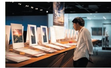
東北復興イベント2019 特別展「陽-HARU- Light & Letters 社内でのプレ展示