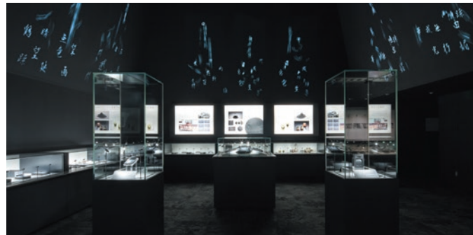
工芸品の硯から文化の書文字へと繋がる美の連続性を意識した空間