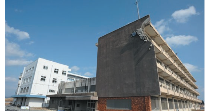
震災遺構 旧気仙沼向洋高校