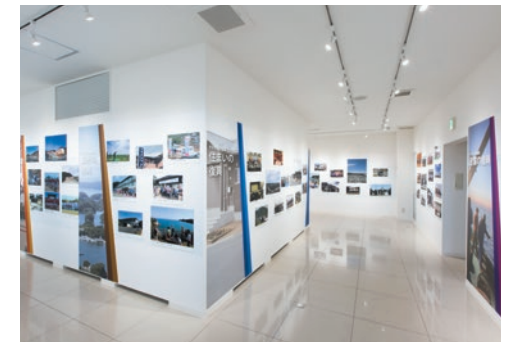
復興に関わった方々への感謝と、市のこれからをテーマとした展示