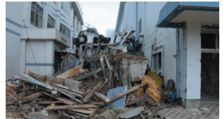
「見える証」として保全されているがれき