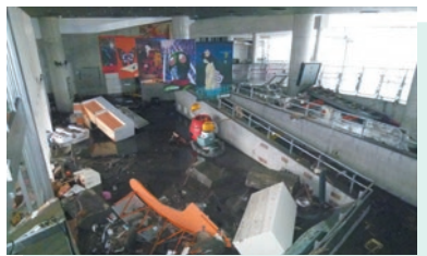
被災した「石ノ森萬画館」