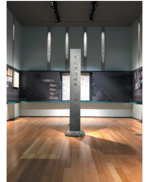
自然の脅威を後世に伝える