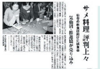
『河北新報』2014年4月22日朝刊より