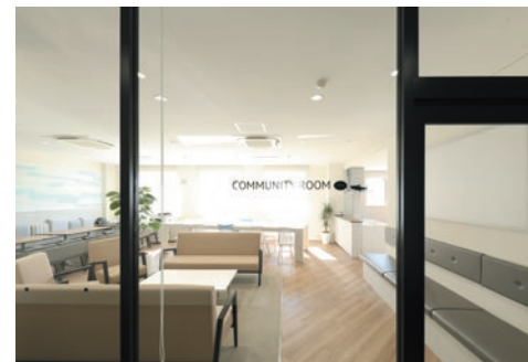
明るく温かみのあるコミュニケーションルーム