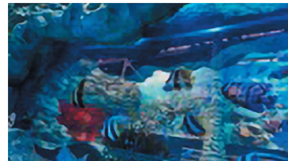
水槽越しに見た景色では、色とりどりの魚が空間を埋め尽くすような錯覚をおぼえる