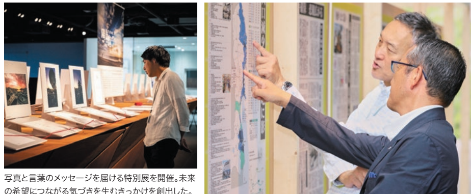
写真と言葉のメッセージを届ける特別展を開催。未来の希望につながる気づきを生むきっかけを創出した。