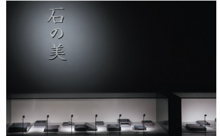
石肌の重厚さと軽やかな書体の美しさを持つ雄勝石によるサイン