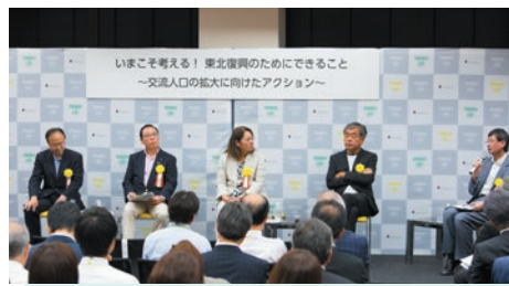
2017年イベントで実施された被災地の復興に尽力されてきた方々を招き、交流人口の拡大をテーマとしてシンポジウムを実施