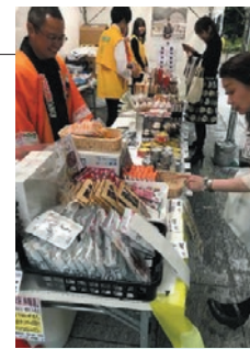
東北復興イベント2018 被災地産品直売会の様子