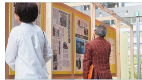
地域に根ざした『河北新報』の新聞報道記事や、被災地における富士通様と丹青社のアクションなどを展示で紹介