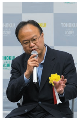
復興庁統括官付参事官(当時)

シカゴ大火の後の、鉄・コンクリートの文化の始まりは、米国の発展に大きく寄与し、歴史的に見ても大災害などのインパクトはデザイン/社会を変える契機となってきたという事例について話された。そこから紐づけて、被災地で立ち上がったシェアエコノミーやコミュニティの形などの新しい「幸福」の定義は、新しい価値として東北から発信していくべきで、東北の多様な技術、自然・文化などの良さが、デザイナーの感性や企業力による支援も得ながら、さらに世界に知られていく必要があると協力を呼び掛けた。