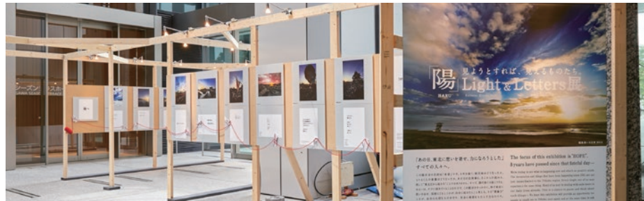
特別展:「陽」—HARU— Light & Letters 展 写真:平林克己氏 文:横川 謙司氏