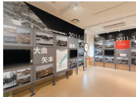
震災の記録の展示