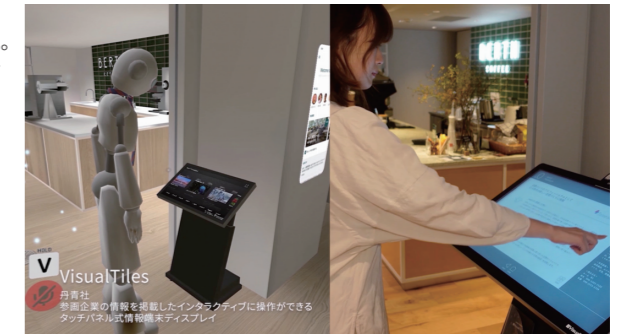
【企業共創空間 point 0 marunouchi のバーチャル空間化】