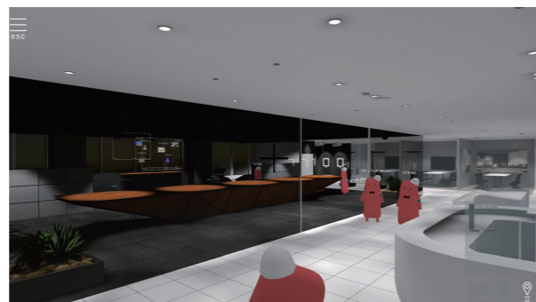
社内のナレッジ共有のオンライン化、およびアバターを介した会話やチャットによって社内のコミュニケーションがどう進化していくか試行している。