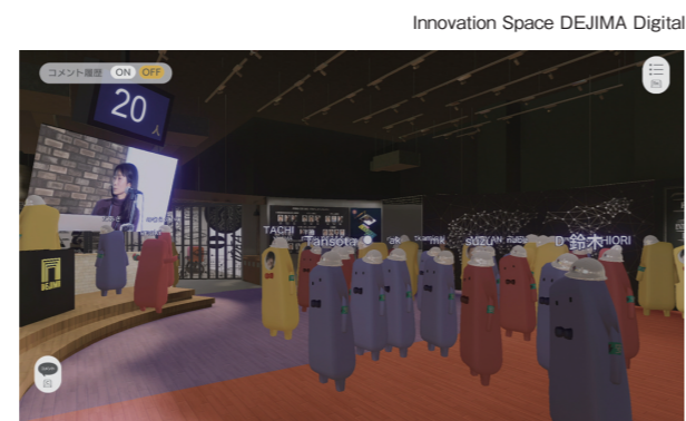
写真1：VR技術を活用したコミュニケーションによる新しいオープンバージョンモデルの確立に向けた伊藤忠テクノソリューションズと丹青社の共同プロジェクト。Innovation Space DEJIMAをバーチャル化し、実態の外見や能力にとらわれず自由な自己表現ができるアバターと、リアルスペースにいる人が複合的にコミュニケーションを行う施策を実施。

このように、空間メディアにおける映像の重要性増大、設計過程で生まれるCGという仮想空間の活用、これら2要素の機運が高まる中、ついには、リアル空間の設定そのものがバーチャル上で展開される『リアルに迫る没入度のバーチャル』が実現できるようになりました。つまり、空間の完全なデジタル化ではなく、