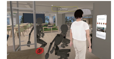
バーチャル空間に外部ゲストを招いてpoint 0 marunouchiのバーチャル体験会を実施。

させるため、リアル・バーチャルが垣根なく融合する空間デザインには期待も大きく、チャレンジのしがいがあると考えています。特にリアル空間を扱うデザイナーと、バーチャル空間のデザイナーが分かれて、空間づくりを行うのではなく、ニーズに合わせてトータルにリアルとバーチャルを設計することで、これまでにない空間体験を提供することができるでしょう。