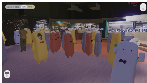
アバターコミュニケーションとして、体の動きで表現するボディエモートのほか、テキストチャットによる会話、ボイスチャットによる生の会話が可能。さまざまな所作によって、バーチャルであっても「そこに人がいる」実感のあるコミュニケーションをすることができる。

また、リアル空間では重力や建築構造、人間のスケールを考慮した設計が基本となります。これらを考えなくてもバーチャル空間は成立しますが、これらを意識することで、バーチャル空間においても、心地よいスケールや安心感につなげることができると考えています。現実世界で見たことある造形、体感したことのあるスケールをバーチャル空間内でも感じることができれば、バーチャルであろうと空間自体に高い体感性と親近感、愛着感を生み出せると考えています。