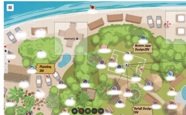
バーチャルオフィスツール (oVice) を活用し、誰が席にいるかの共有や簡単な雑談、ミーティングがしやすい環境にチャレンジしている。