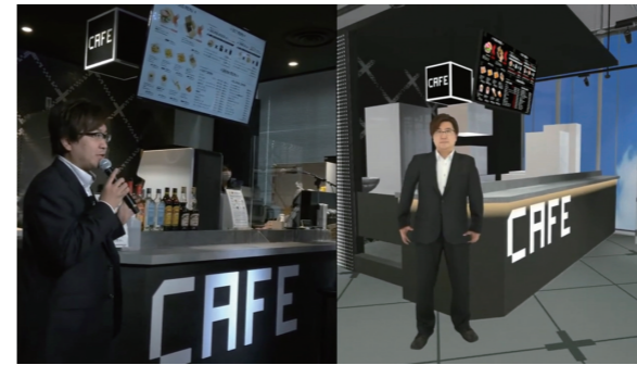
【eXeField Akiba ハイブリッド空間内覧会】

空間の設けだけでなく、展示内容も実空間同様の流れを動線に沿って体験できるようになっている。オンラインからでも「ストーリー性」をもった情報共有とコミュニケーション体験が可能。