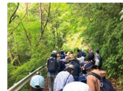
和歌山県南紀地域でのプログラム交流

被災地復興 / ウェルビーイング / コミュニケーション / D&I(ダイバーシティ&インクルージョン) / 地域企業支援 / ローカルベンチャー共創 / 地域貢献活動