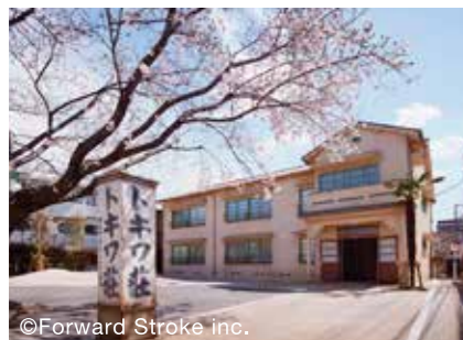
豊島区立トキワ荘マンガミュージアム(豊島区)

空間づくりの企画・設計・制作・運営のノウハウを用いて、地域の資源を活用した、場を中心としたにぎわいづくりを行い、地域のコミュニティ形成、地域の持続的な活性化に寄与していきます。