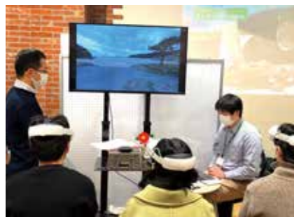
五島市UIターン相談会～五島を感じる！XRで島暮らし体験～(株式会社 NTT ドコモ)

映像、音響、照明、ネットワークやVR等のあらゆる空間演出のテクノロジーを用いて、地域の魅力を最大限に引き出し、広く多くの人に魅力が伝わるコンテンツを制作します。また、最新のDX・ICT技術を用いて、サステナブル、レジリエンスな社会実現へアプローチします。