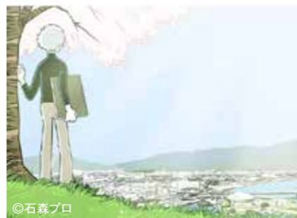
「ジュン～春の針～」(石巻市)

リアル×バーチャル連携 / 歴史・文化体験演出 / 観光DX / ICT / スマートシティ / データマーケティング / NFT / メタバース