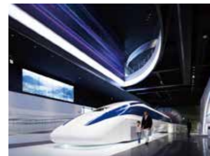
山梨県立リニア見学センター(山梨県)