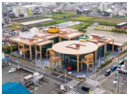
春華堂本社複合施設「スイーツバンク(SWEETS BANK)」(有限会社 春華堂)