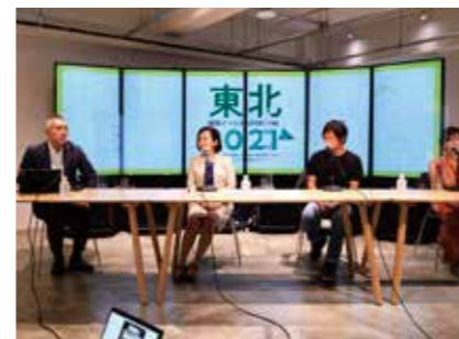
東北復興イベント

「ふるさとのかつての元気を取り戻したい」「地域に新しい活力を作りたい」丹青社は社員の地域貢献活動に対する支援を強化し、社員を通して地域を盛り上げ、よりよい社会づくりへのチャレンジを行なっていきます。