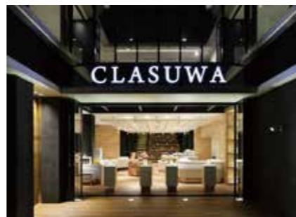
くらすわ(養命酒製造株式会社)

地域資源発掘 / 観光への寄与 / 遊休地活用 / にぎわいづくり / シビックプライド醸成 / 地域コミュニティ醸成