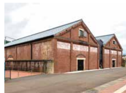
敦賀赤レンガ倉庫・ジオラマ館(敦賀市)

地域が抱える課題を解決するため、地域の皆さまと共に考えて、施設運営における場の活性化や事業作り・人材育成を行い、地域の産業の再生と持続的な発展を目指して活動を行っています。