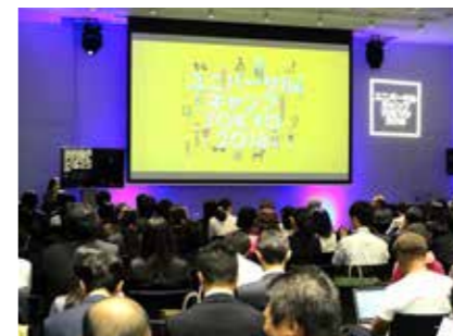
ユニバーサルキャンプ TOKYO