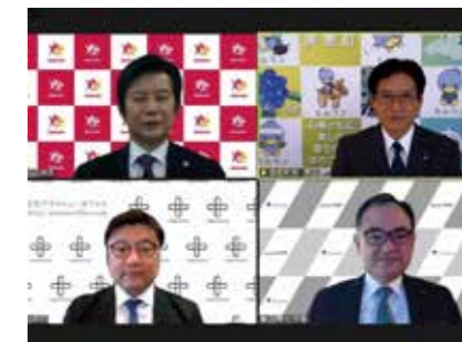
埼玉県美里町との3社での地域活性化連携協定(美里町)

活性化イベント / サステナビリティ / 地域文化の継承 / 施設運営 / 産業・雇用創出 / 事業共創 / 分散化社会への寄与