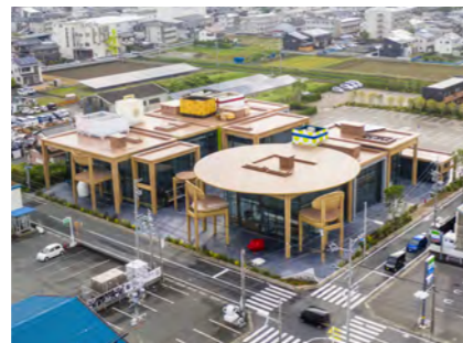
春華堂本社複合施設「スイーツバンク(SWEETS BANK)」 (有限会社 春華堂)