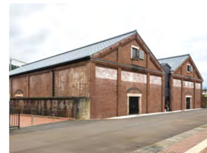
敦賀赤レンガ倉庫・ジオラマ館(敦賀市)

地域が抱える課題を解決するため、地域の皆さまと共に考えて、施設運営における場の活性化や事業作り・人材育成を行い、地域の産業の再生と持続的な発展を目指して活動を行っています。