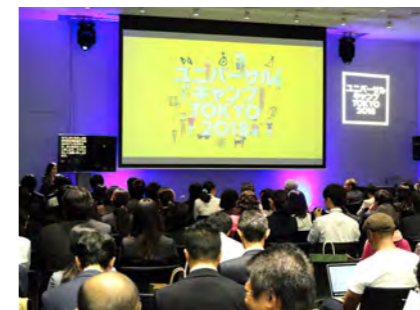
ユニバーサルキャンプ TOKYO