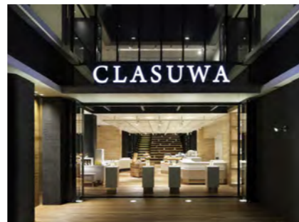
くらすわ(養命酒製造株式会社)

地域資源発掘 / 観光への寄与 / 遊休地活用 / にぎわいづくり / シビックプライド醸成 / 地域コミュニティ醸成