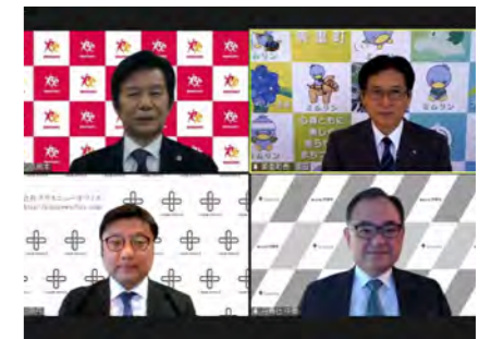
埼玉県美里町との3社での地域活性化連携協定(美里町)

活性化イベント / サステナビリティ / 地域文化の継承 / 施設運営 / 産業・雇用創出 / 事業共出 / 分散化社会への寄与