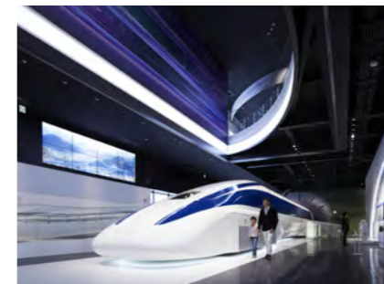
山梨県立リニア見学センター(山梨県)