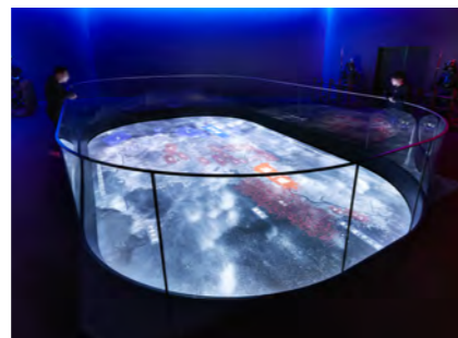
岐阜関ヶ原古戦場記念館(岐阜県)