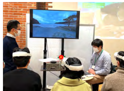
五島市UIターン相談会～五島を感じる! XRで島暮らし体験～(株式会社 NTT ドコモ)

映像、音響、照明、ネットワークやVR等のあらゆる空間演出のテクノロジーを用いて、地域の魅力を最大限に引き出し、広く多くの人に魅力が伝わるコンテンツを制作します。また、最新のDX・ICT技術を用いて、サステナブル、レジリエンスな社会実現へアプローチします。