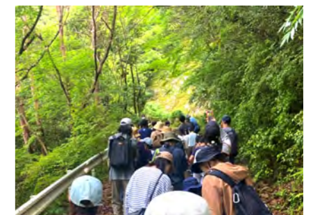
和歌山県南紀地域でのプログラム交流

被災地復興 / ウェルビーイング / コミュニケーション / D&I(ダイバーシティ&インクルージョン) / 地域企業支援 / ローカルベンチャー共創 / 地域貢献活動