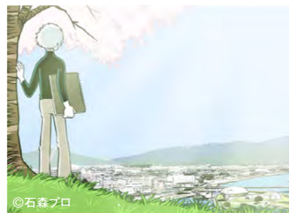
「ジュン～春の針～」(石巻市) ©石森プロ

リアル×バーチャル連携 / 歴史・文化体験演出 / 観光DX / ICT / スマートシティ / データマーケティング / NFT / メタバース