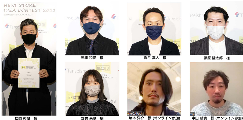
表彰式にお集まりいただいた受賞者の皆さま（一部オンライン参加）