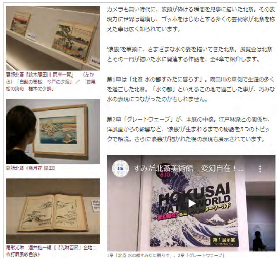
取材レポートは、YouTubeに掲載している動画と併せて楽しめる（「すみだ北斎美術館」で行われた過去の企画展より）

加えて、新型コロナウイルスの感染拡大予防のため臨時休館となり、準備が整いながらも開催ができない企画展・特別展のようすを写真等でご紹介する特集「新型コロナウイルス感染症対策により開幕延期・中止になった展覧会」を4月12日に公開しました。コンテンツは順次追加予定です。