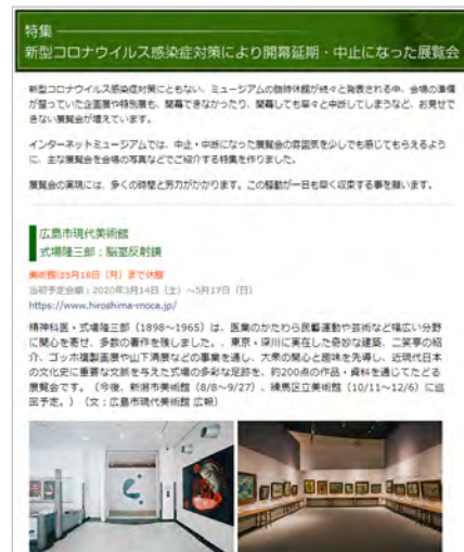
特集「新型コロナウイルス感染症対策により開幕延期・中止になった展覧会」

なお、新型コロナウイルス感染予防にともなう全国のミュージアム休館情報をまとめた「新型コロナウイルス感染予防にともなう、ミュージアム休館情報」も公開しています。