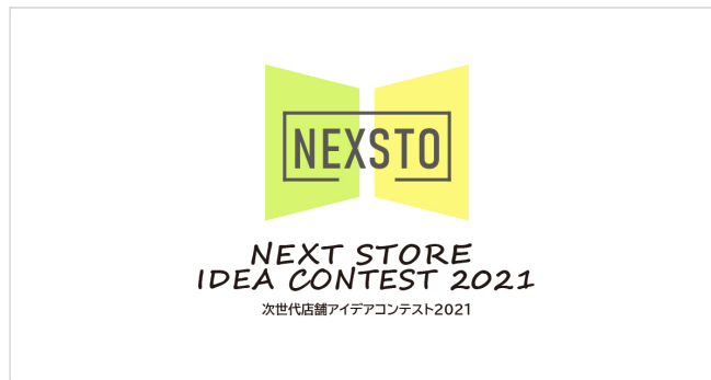
コンテスト メインビジュアル

丹青社は本コンテスト開催を通して、より多くの方に新たなお店づくりについて考える機会を創出し、セレクトショップやレストランチェーン等の丹青社のクライアントを審査員に迎え、丹青社のデザイナーらとともに、優れたアイデアを取り入れた店舗具現化の可能性を探ります。時代を読む目を力に空間づくりのフィールドを拡げ続けてきた丹青社が、クライアントと一緒に次世代店舗を生み出すオープンイノベーションを推進し、さまざまな空間づくりを手がける総合ディスプレイ業だからこそ生み出せる、これからの空間への期待感の醸成を目指します。