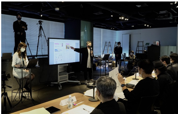
昨年最終審査会の様子

丹青社は本コンテスト開催を通して、さまざまな方に新たなお店づくりについて考える機会を創出し、セレクトショップやレストランチェーン等の丹青社のクライアントを審査員に迎え、丹青社のデザイナーらとともに、優れたアイデアを取り入れた店舗具現化の可能性を探ります。昨年、数多くの応募の中から最優秀賞に選出されたアイデアは実現化に向けた検証をクライアントとともに続けています。時代を読む目を力に空間づくりのフィールドを拡げ続けてきた丹青社が、クライアントと一緒に次世代店舗を生み出すオープンイノベーションを推進し、さまざまな空間づくりを手がける総合ディスプレイ業だからこそ生み出せる、新たな空間づくりにチャレンジします。