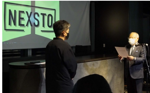
昨年の表彰式の様子