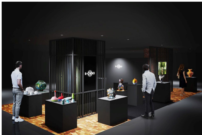
「B-OWND Gallery」 イメージパース