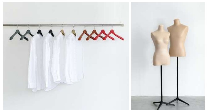
左：アップサイクルハンガー、右：アップサイクルトルソー