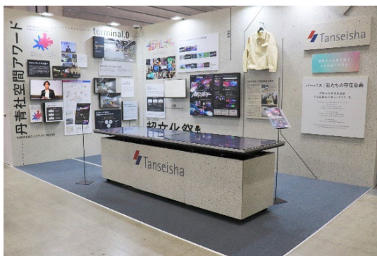
「SC ビジネスフェア 2025」丹青社ブース

これまで「空間づくり」に携わる従業員の安全を支えてきた当社のワークウェア。アップサイクルで形を変え、これからはオフィス環境のひとつとして「空間づくり」を支え続けます。