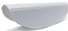
● 小林幹也 ● 小林幹也スタジオ ● 池岡真穂 ● 前橋蓮太郎