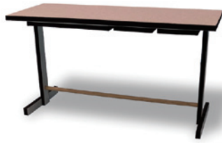
● イトウケンジ ● MUTE ● 大川瑠子 ● 比佐航