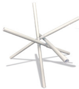
● 長岡勉 ● POINT ● 小林里映 ● 田中知里