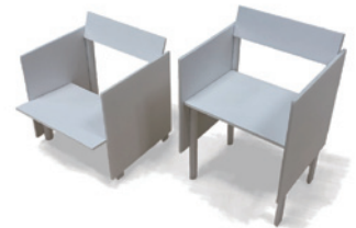
● 鈴野浩一 ● トラフ建築設計事務所 ● 川島怜奈 ● 又吉和真