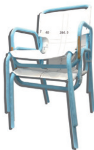
● 林裕輔 ● 安西葉子 ● DRILL DESIGN ● 石田莉菜 ● 三宅航平