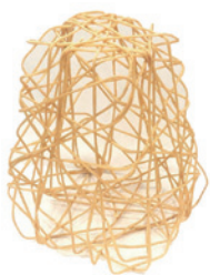
● 橋本潤 ● フーニオデザイン ● 永野千夏 ● 宮城七海