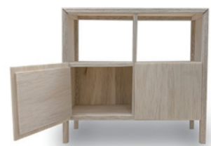
● 藤森泰司 ● 藤森泰司アトリエ ● 小野田祥太 ● 武永梨恵