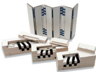
● 湯澤幸子 ● ASSOCCA STYLE ● 大原貴子 ● 藤ノ木時子