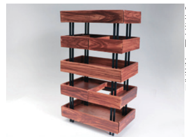
● 鳴川肇 ● 慶應義塾大学 鳴川肇研究室 ● 坂井一隆 ● 渡辺真由