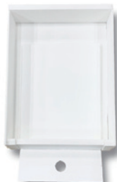
● 上垣内泰輔 ● 天野亮太 ● 丹青社 ● 大久保玲亮 ● 菊田海来