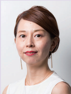
株式会社デザインセンター プリンシパル クリエイティブディレクター