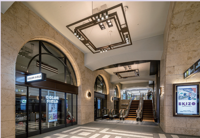
東館1階コンコース