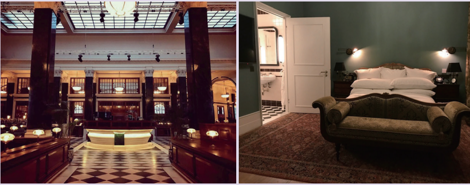
The NED LONDON