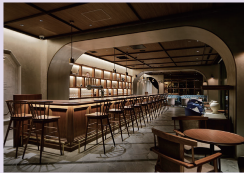
ザセラールN パロン・ナガサワ:若い世代にもホテルに親しんでもらうため、気軽に1杯、ひとりでも入りやすいカウンターをメインとしたワインバー