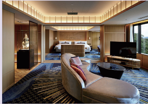
インペリアルスイート:鹿児島や九州の伝統工芸を取り入れた客室