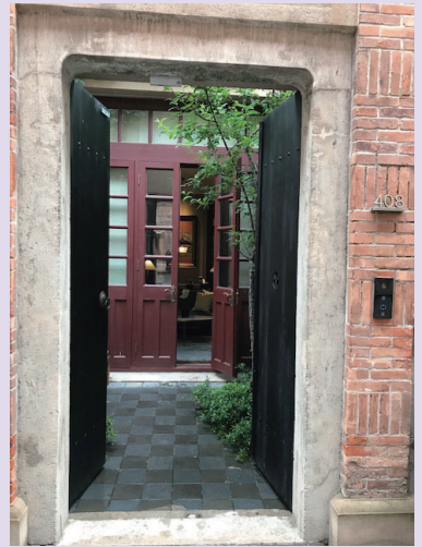
Capella Shanghai Jian Ye Li