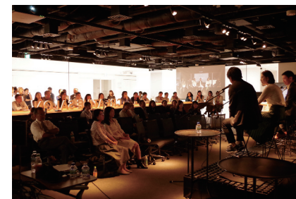
クリエイティブミーツ

遠くまで見渡せて、コミュニケーションを生み出しやすい空間をつくるために間仕切りをなくしたワンボックス空間