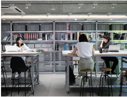
マテリアルストレージと大型カウンター