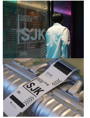
パッケージタグを連想させるサインデザイン

これまでの数ヵ月を振り返り、効果が実感できたプラス面、そして想定していなかったことや修正が望まれるようなマイナス面について何かありましたか。