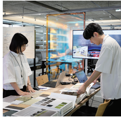
実証実験のクリエイティブワークの様子