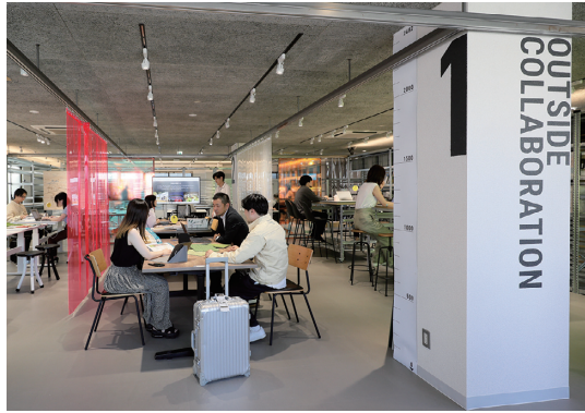
ゾーン1/アウトサイドコラボレーションの全景