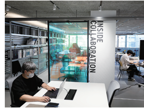
ゾーン2/インサイドコラボレーションの様子