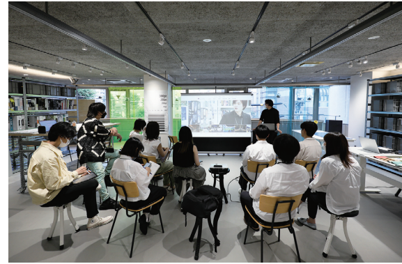
プレゼンテーションの場に空間をハックできる