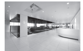
本社オフィス（品川／現在）