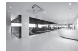
本社オフィス（品川／現在）