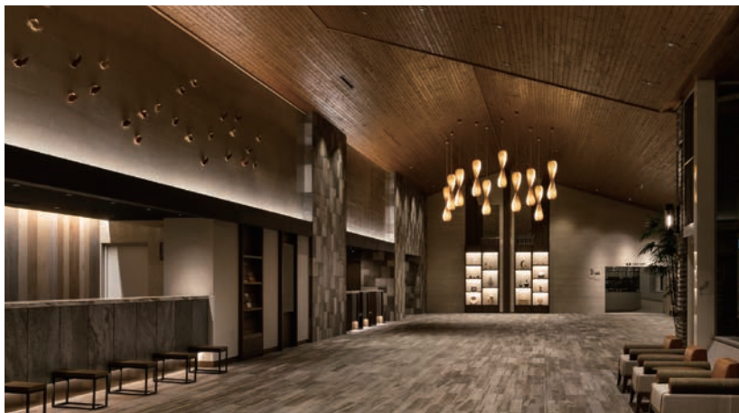
Karuizawa Prince Hotel West

【Client】 PRINCE HOTELS, INC. 【Services Provided】 Design, Layout, Production, Construction