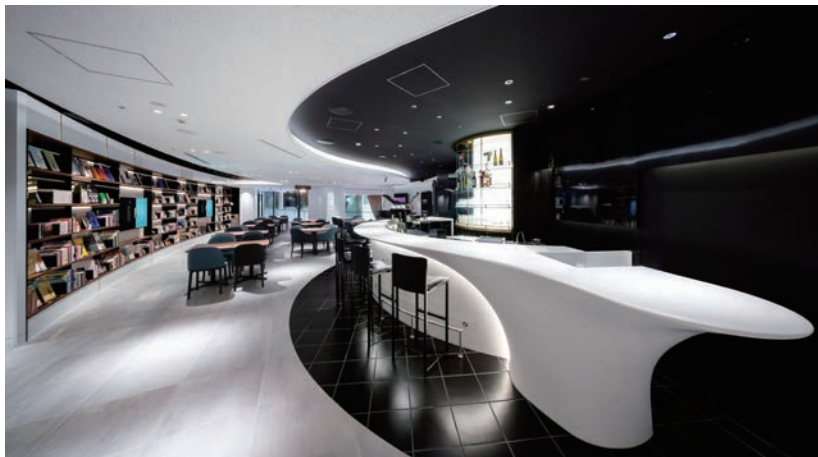
Yamaha Ginza Store 1F, 2F Brand Experience Area NOTES BY YAMAHA

【Client】 Yamaha Corporation 【Services Provided】 Design, Layout, Production, Construction, Project Management