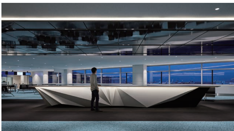
Tokyo International Airport Terminal 2 International Gate Area

【Client】 Japan Airport Terminal Co., Ltd. 【Services Provided】 Design, Layout, Production, Construction 【Prime contractor for Design】 Azusa, Yasui, PCPJ Tokyo International Airport Terminal 2 International Flight Facilities Design and Supervision Joint Venture 【Prime contractor for Production & Construction】 Taisei Corporation